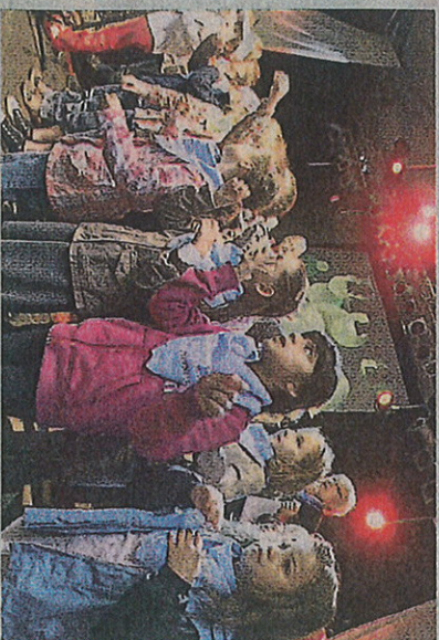
Süß: Kinder sangen beim Familienfest.