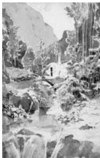
Sepia auf Graphit: „Bergschlucht“, 1829. FOTO: ADK BERLIN

Wieder nichts mit der obligatorischen Reise nach Italien, die im frühen 19. Jahrhundert noch zu jeder ordent-