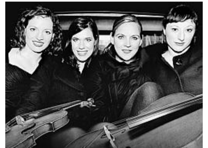
Gefährliches Quartett: Salut Salon.

info Salut Salon: DVD „Klassisch verführt“ (EMI). Live 26.2., 19:30 Uhr, Staatstheater Cottbus, 7.-14.3. Tipi am Kanzleramt Berlin.