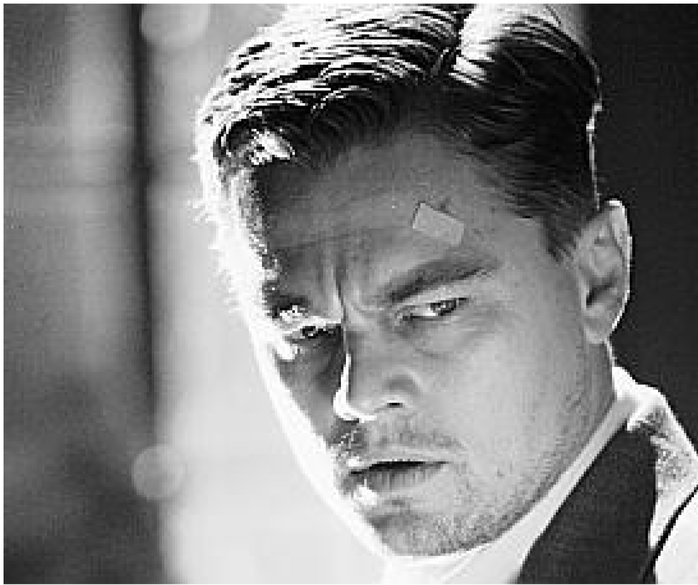
Die tiefe Sorgenfalte rettet den Film auch nicht: Leonardo DiCaprio als Kriminalbeamter Teddy Daniels.

DiCaprio: Wir haben ja sogar in einer alten, stillgelegten psychiatrischen Anstalt gedreht. Da hatte man schon das Gefühl, dass die Geister