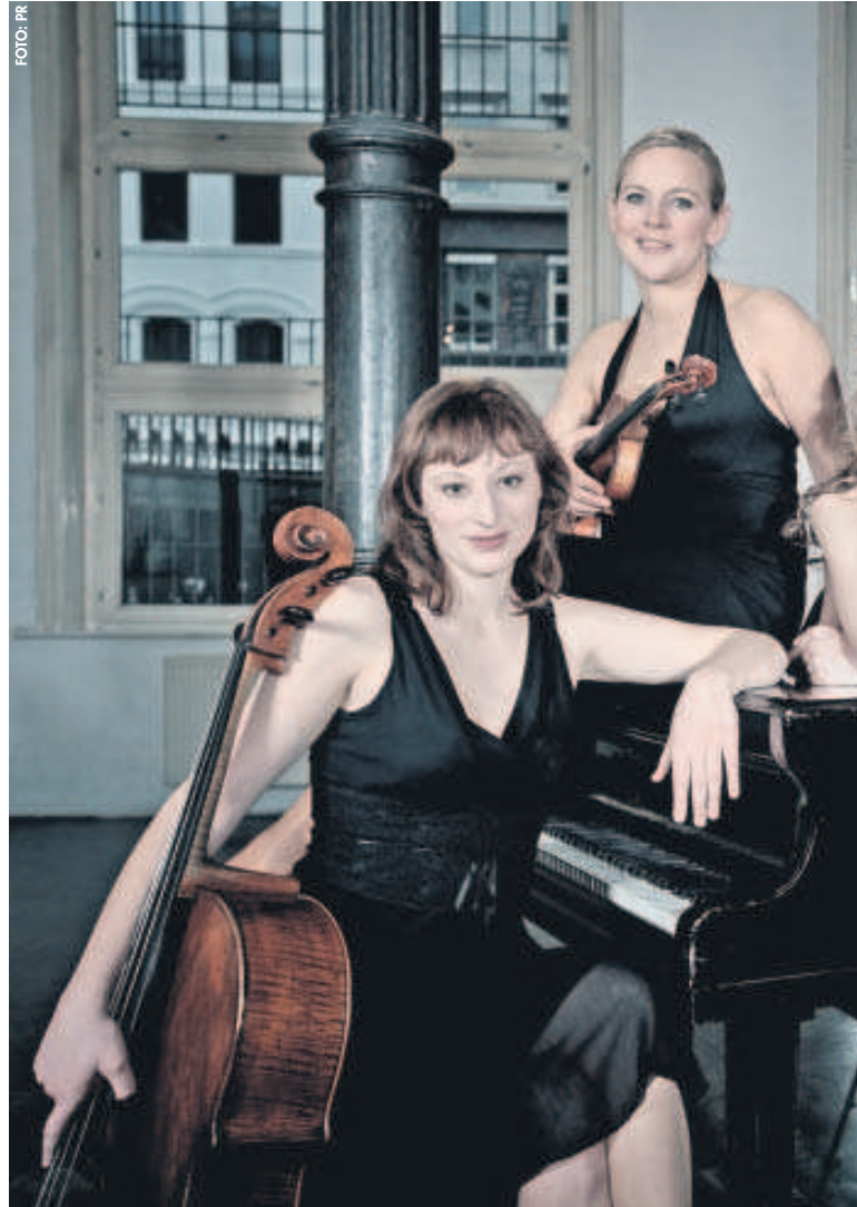
Salut Salon: Vier attraktive Damen wollen

Das Hamburger Kammerquartett Salut Salon will mit seinem aktuellen