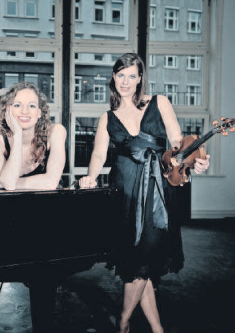
klassische Musik mit einer unterhaltsamen Show von jeglichen Klischees befreien

Programm „Klassisch verführt“ in der Komödie Dresden Verwirrung stiften