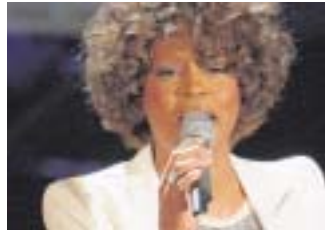
Whitney Houston