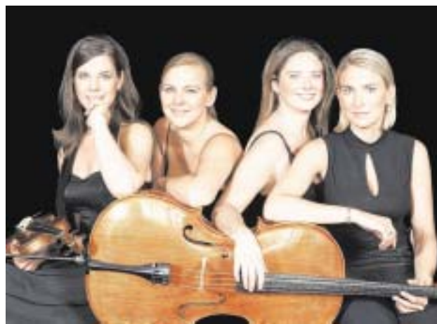
Aparte Kombination: Salut Salon!

In bislang einzigartiger Weise schaffen die vier technisch perfekten Musikerinnen den Spagat zwischen Klassik und Pop, zwischen interpretatorisch ausgereifter Wiedergabe der Stücke und einer für Klassik außergewöhnlichen Leichtigkeit. Das alles mit einer Pri-