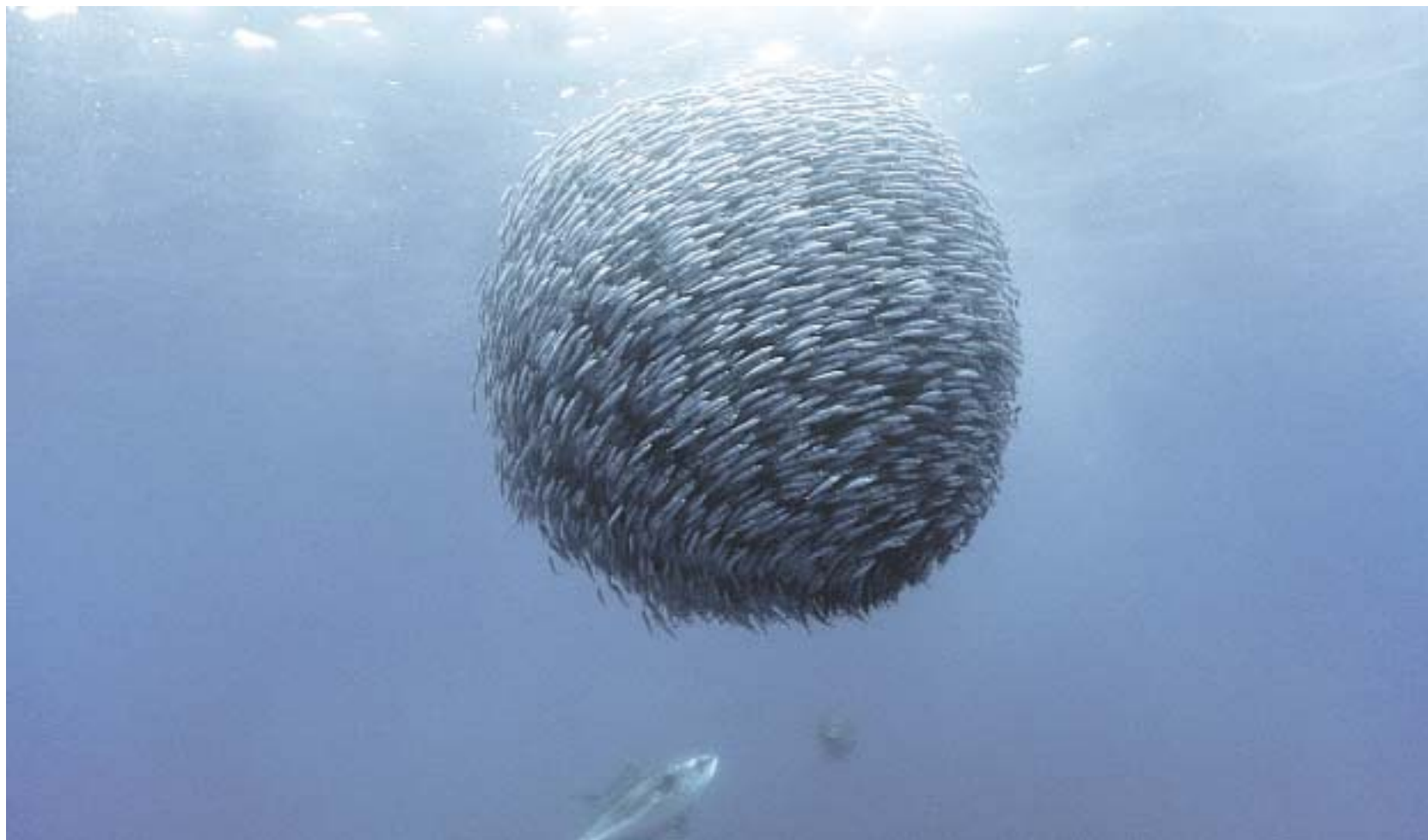
Die Kugel lebt - um angreifenden Feinden kein Ziel zu geben, formiert sich ein Makrelenschwarm zum rasend schnell rotierenden Rundkörper.