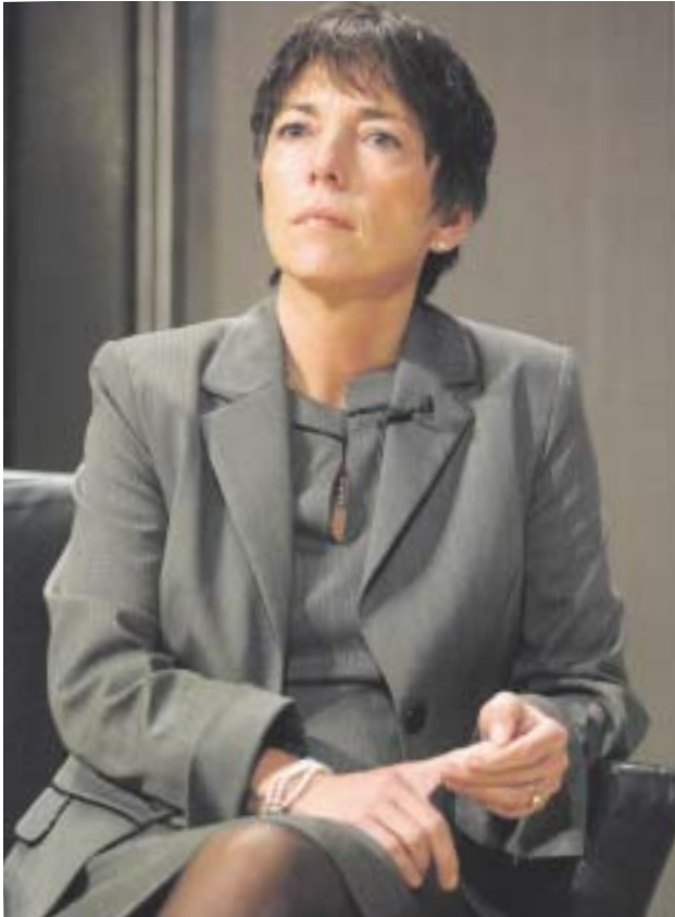
Betrunken am Lenkrad: Margot Käßmann, Ratsvorsitzende der Evangelischen Kirche