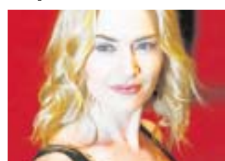
Kate Winslet

London. Die britische Schauspielerin Kate Winslet bewahrt ihren Oscar im Bad „hinten auf der Toilette“ auf – ihre Erklärung: „Im Grunde will jeder ihn mal anfassen, ihn halten und sagen, 'Oh mein Gott' und 'Wie schwer ist er'? Also dachte ich mir, wenn ich ihn ins WC stelle, können die Leute sich diese ganze 'Wo ist dein Oscar'-Sache sparen“, sagte Kate Winslet jetzt in einem Interview.